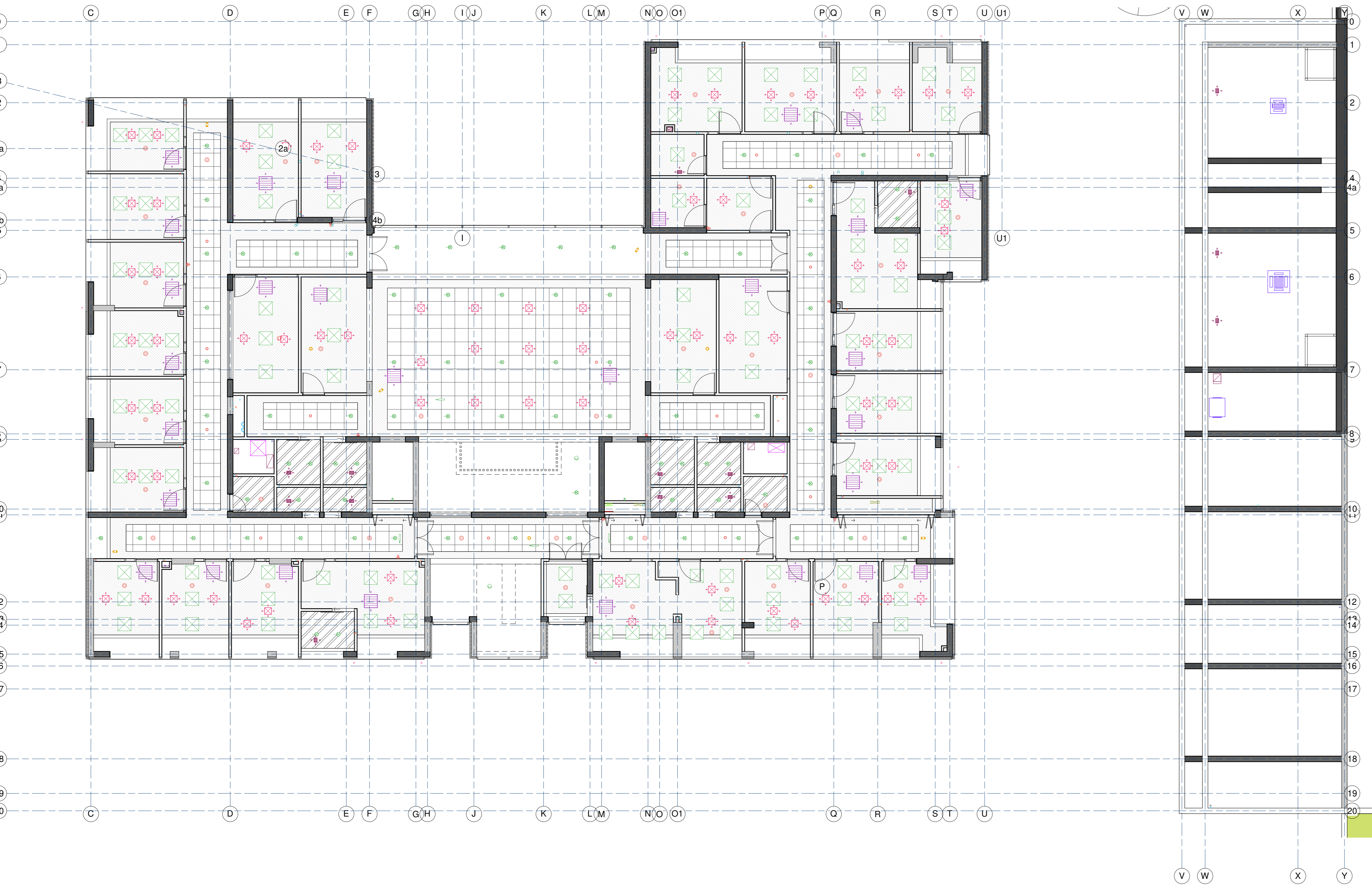
Planta Cielo Reflejado Piso 2 1 : 100